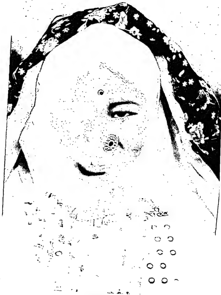
हिमालय का सौन्दर्य